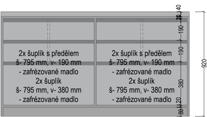
M 10 - pohled 02